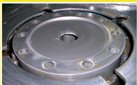
Produkt: lastbilsfälg Applikation: stansning av hål Arbetsmaterial: 14 mm tjock SS 1311

Snäva analysgränser höjer kvaliteten på stålet och innebär en försäkran om att egenskaperna blir lika från gång till gång. Dessutom finns vi alltid till hands med teknisk kunskap, rådgivning och support. Med Uddeholm som partner blir det lättare att uppnå dina mål.